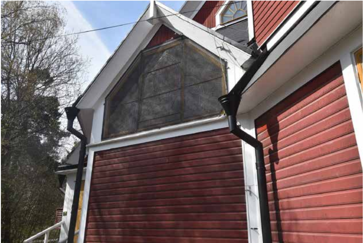
Korfönstrets tidigare skydd bestående av ett stål-galler.