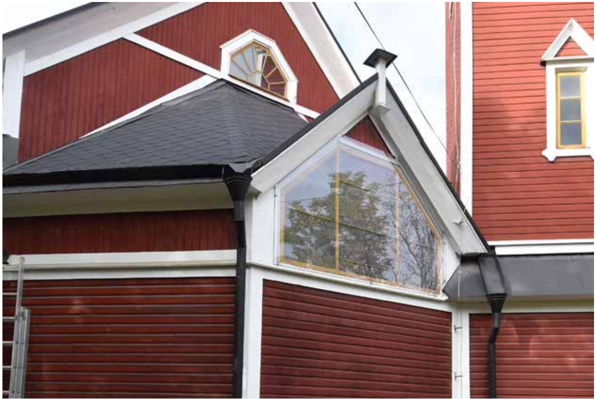
Korfönstrets nya skydd av polykarbonatglas.