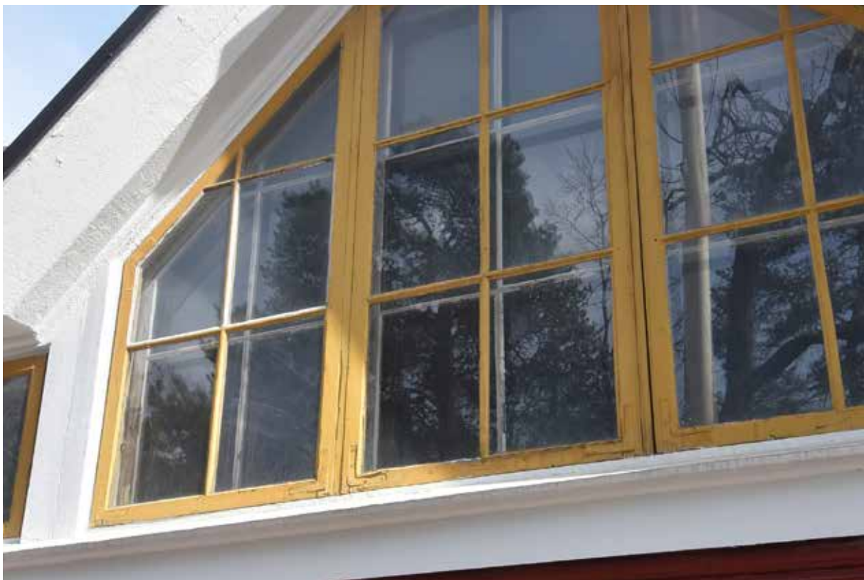
Ett av långhusets fönster innan åtgärd

Det finns allmänna problem med att hålla kyrkan varm. Det är svårt att få innerbågarna att sluta tätt mot anslagen och i sakristian och i det lilla andaktsrummet som tidigare var ett vedförråd saknades innerbågar helt.