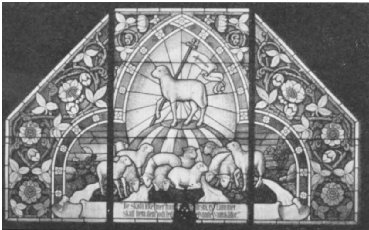
Korfönstrets glasmålning. De söta fåren är en symbol för människan på jorden.