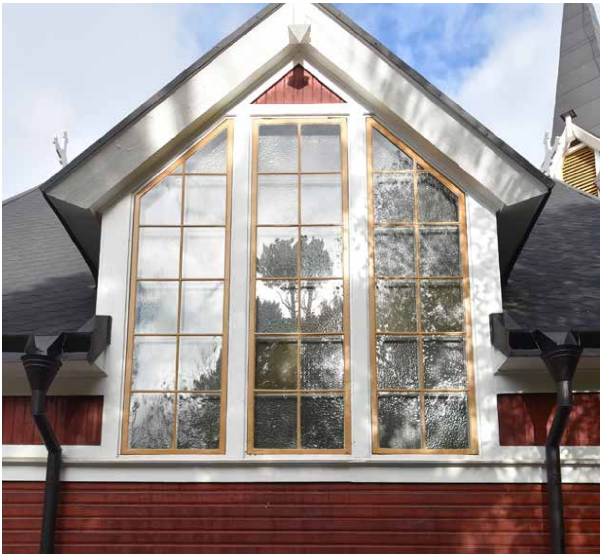
Ett av långhusfönstren efter avslutade åtgärder

Tätninglister skulle också monteras, enligt beslutet skulle dessa monteras på ytterbågarna men detta är sannolikt ett missförstånd i ärendets handläggning då tätninglister normalt monteras på innerbågen. Denna åtgärd är emellertid inte heller utförd.