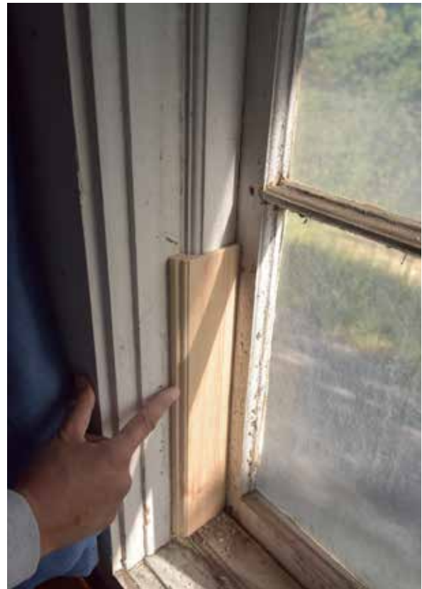
Detalj från sakristian. T.v, pilen visar anslaget före den planerade innerbågen. T.h Förslag på anslagslist som ger en större anslagsyta mot en innerbåge.